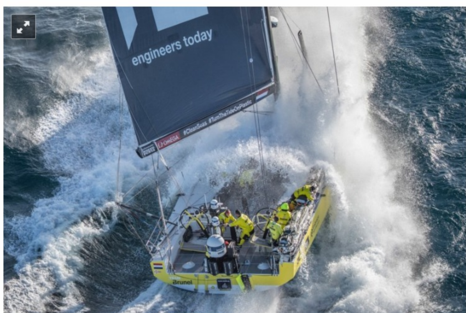
O Team Brunel foi o primeiro a chegar a Cardiff DR

Team Brunel e Dongfeng foram os grandes vencedores da nona e antepenúltima etapa da Volvo Ocean Race (VOR) 2017-18, que terminou nesta terça-feira, em Cardiff. Após um final emocionante devido aos fracos ventos e fortes correntes que se fizeram sentir no canal de Bristol, o Team Brunel derrotou no sprint final o AkzoNobel, enquanto o terceiro lugar do Dongfeng garante à equipa liderada pelo francês Charles Caudrelier o regresso à liderança, devido à má prestação do MAPFRE: os espanhóis terminaram na quinta posição.