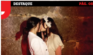
Discretamente algumas marcas têm apresentado imagens comportamentos positivos em relação à realidade das pessoas LGBT. Outras optam até por um discurso militante