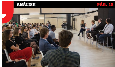
O nível de empatia percebida das marcas por parte dos consumidores portugueses foi analisado pelo Cision, num estudo desenvolvido em parceria com a Netquest. Conheça os resultados